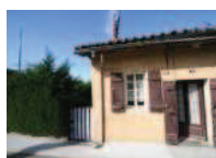
Vente Maisons / Villas 83000 €