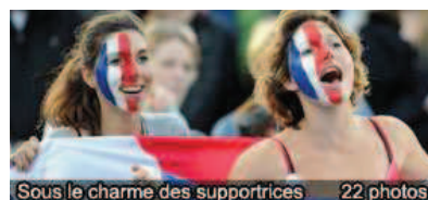
Sous le charme des supportrices 22 photos

Auch. A l'ombre après défaut d'éclairage