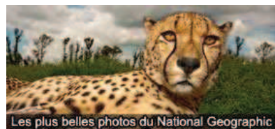
Les plus belles photos du National Geographic