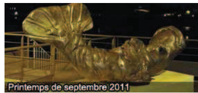
Printemps de septembre 2011