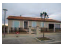
Location Maisons / Villas 930 €