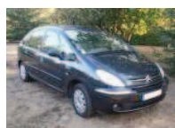
CITROEN Picasso 10000 €