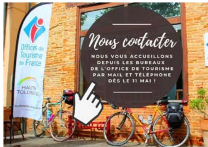
Office de Tourisme des Hauts Tolosans 05 61 82 93 85 - tourisme@hautstolosans.fr

Une ouverture au public est envisagée vers la mi-Juin (si les conditions sanitaires le permettent).